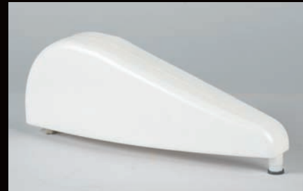
Réservoir de grande contenance (2 litres) réduisant les arrêts de production et les remplissages.