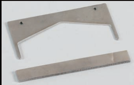
Nouveau profil des couteaux de découpe

Acier inox 420HC assurant une longévité accrue et une grande facilité de nettoyage